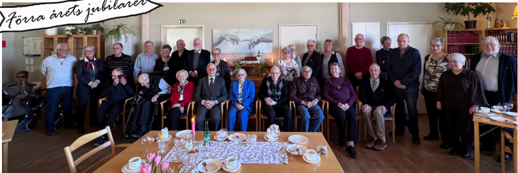
Jubilarerna vid födelsedagsfesten som anordnades av Kareby församling i början av året, för de medlemmar i församlingen som fyllt 70, 75, 80, 85 eller 90+ under förra året.